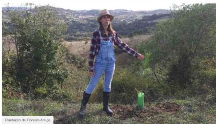
Plantação da Floresta Amiga