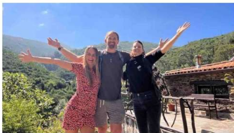
Floresta Amiga estabelece aliança com comunidade internacional 'Juicy Land'